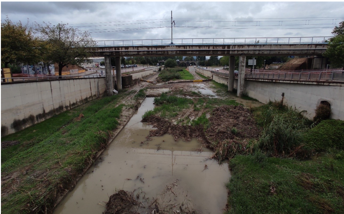
Imatge 2. Estat del subàmbit 1.1 del Mèder des del pont del Blanqueig amb l'execució en curs de les obres de construcció d'un nou pont de la línia ferroviària (imatge del 4/9/2024)

En l'actualitat, i durant el termini en què es preveu executar les obres del projecte de restauració fluvial, té lloc en paral·lel l'execució de les obres de construcció d'un nou pont de la línia ferroviària que creua el riu Mèder al subàmbit 1.1 (en el marc del projecte de construcció de la prolongació de la via 2 a la capçalera sud de l'estació de Vic d'Adif: https://contrataciondelestado.es/wps/poc?uri=deeplink:detalle_licitacion&idEvl=aDZ30vOiCaOrz3GQd5r6SQ%3D%3D ). Tal com es pot veure en la imatge 2, les obres en curs estan comportant a la llera del Mèder (desbrossada, moviments de terres, etc.), que han modificat les condicions del subàmbit que es descriuen al punt 4.5.1.1 de la memòria i que en finalitzar no deixaran l'entorn fluvial exactament en les mateixes condicions amb què es trobava amb anterioritat.